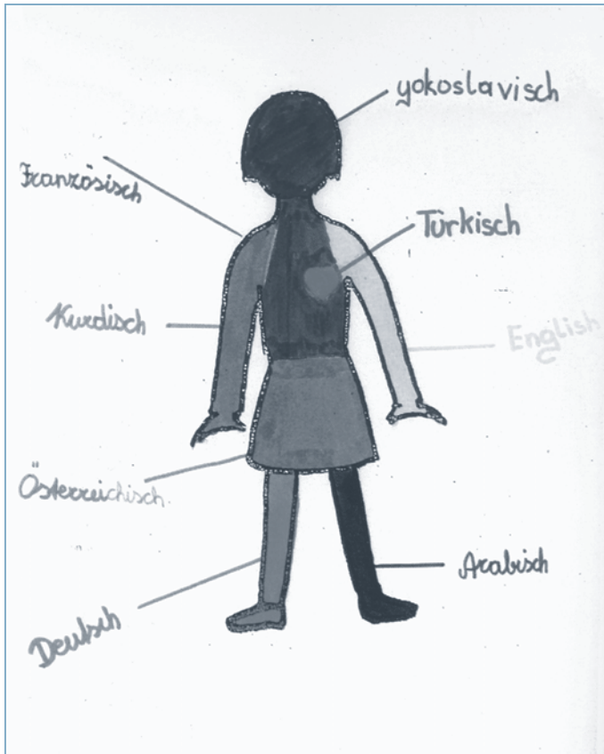
Aus Krumm, Hans-Jürgen (2001): Kinder und ihre Sprachen – lebendige Mehrsprachigkeit , Wien

Dieses Prinzip funktioniert nicht immer automatisch; nicht z. B. dann, wenn die Lernenden es nicht gewöhnt sind, selbstständig zu vergleichen.